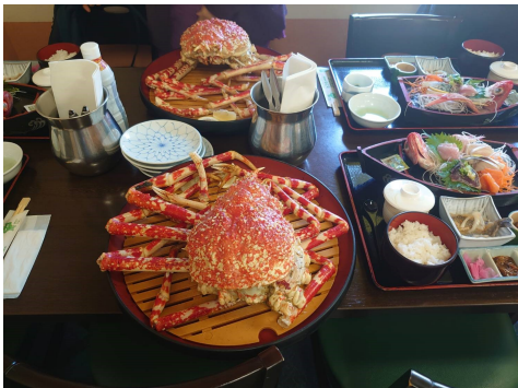
清水魚市場 光徳丸にて昼食