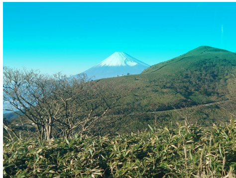
絵葉書のような絶景