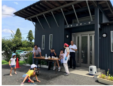
<四之宮会員による将棋教室>