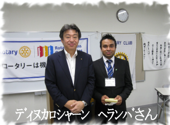
ディナコちゃん ヘランさん

の行動計画とも言われております。またこの優先事項の土台となっているものは、私達が昔から大切に守り続けてきたロータリーの目的であり、4つのテストであり、5つの中核的価値感といった不変のものであります。