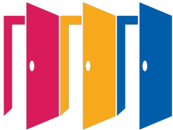
ロータリーは機会の扉を開く

http://www.oamirotary.com E-mail rc@oamirotary.com