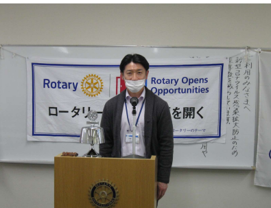
大越 会員 より