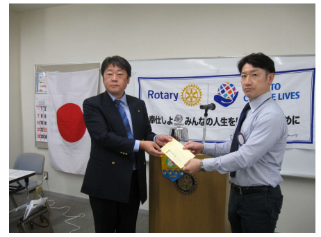
子ども食堂支援金 大越会員へ